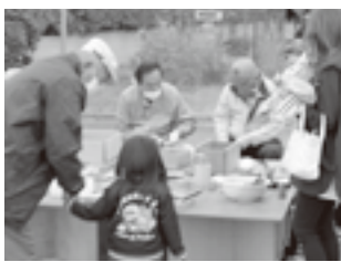
竹ぼうき・熊手などご奉仕価格での販売となりますので、無くなり次第終了です。お早

親子木工教室では、親子で楽しく木に触れながら、子供の自由な感性でいろいろ作ることが出来ますよ。もちろん建築のプロが丁寧にサポートさせていただきます。ご希望の方には、木製品キット(有料・数量限定)を製作して持ち帰りいただけます。また、恒例の竹製品・木工品の販売もやります。竹ぼうき・熊手などご奉仕価格での販売となりますので、無くなり次第終了です。お早