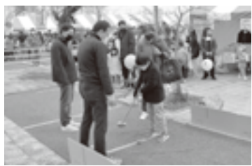
小学生以下のお子様が出来ます。参加費は100円(3回打てます)です。参加費は100円(3回打てます)です。

グラウンドゴルフは専用のクラブでゴルフボールより一回り大きいボールを打ち、ホールポストの輪の中に入れるゲームです。小学生以下のお子様が出来ます。参加費は100円(3回打てます)です。参加費は100円(3回打てます)です。参加費は100円(3回打てます)です。